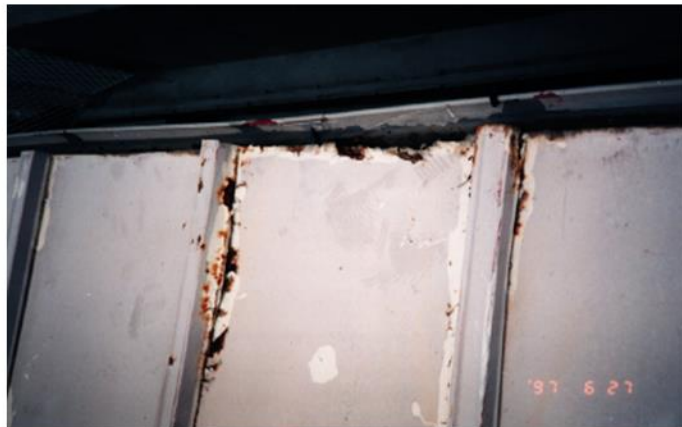
庇の屋根のトタンの瓦棒が腐って、ポロポロの状態です。